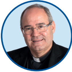
† Francisco Cerro Chaves Arzobispo de Toledo y primado de España