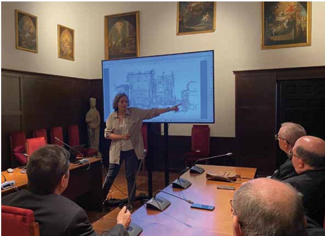
Presentación de los trabajos realizados a los miembros del Cabildo Primado.