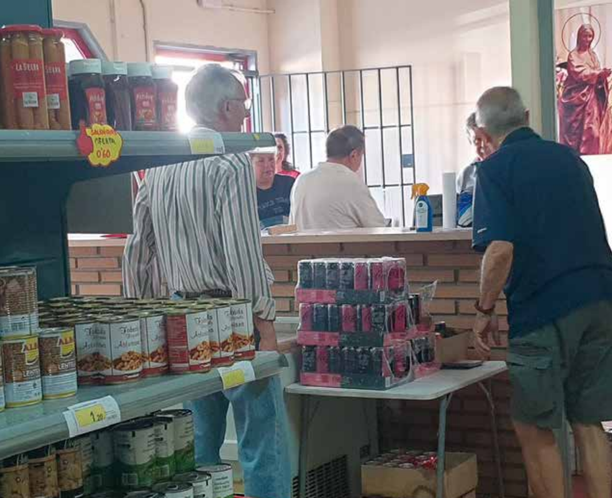
te 2023 se atendió a 944 familias.