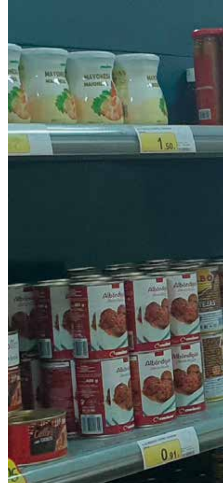
Un economato de Cáritas Diocesana, en los que duran