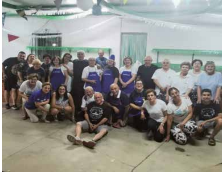
El grupo de voluntarios de Manos Unidas de Villafranca de los Caballeros.