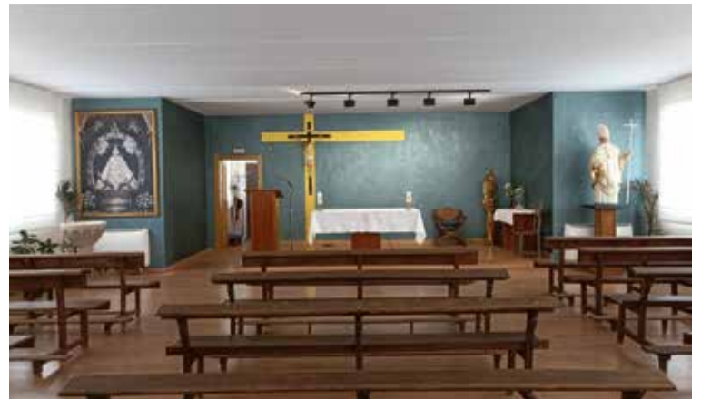
Vista exterior e interior de la capilla de la nueva parroquia.

ficados con la creación de la nueva parroquia de la siguiente manera: al Norte limita con la parroquia San Juan Pablo II, en los límites antes consignados del arroyo de Boadilla».