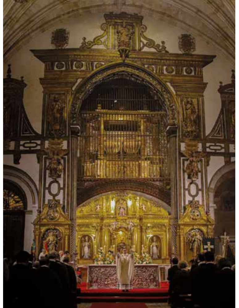
En la parte superior, tras las rejas, se conservan las reliquias de san Ildefonso.

El fin principal de esta cofradía es promover la devoción y el culto a los santos Ildefonso, arzobispo de Toledo, y Atilano, primer obispo de Zamora, así como la de custodiar sus reliquias. Igualmente, dado su vínculo histórico con la archidiócesis de Toledo, fomentar el rito hispano-mozárabe y participar en la solemne procesión del Corpus Christi.