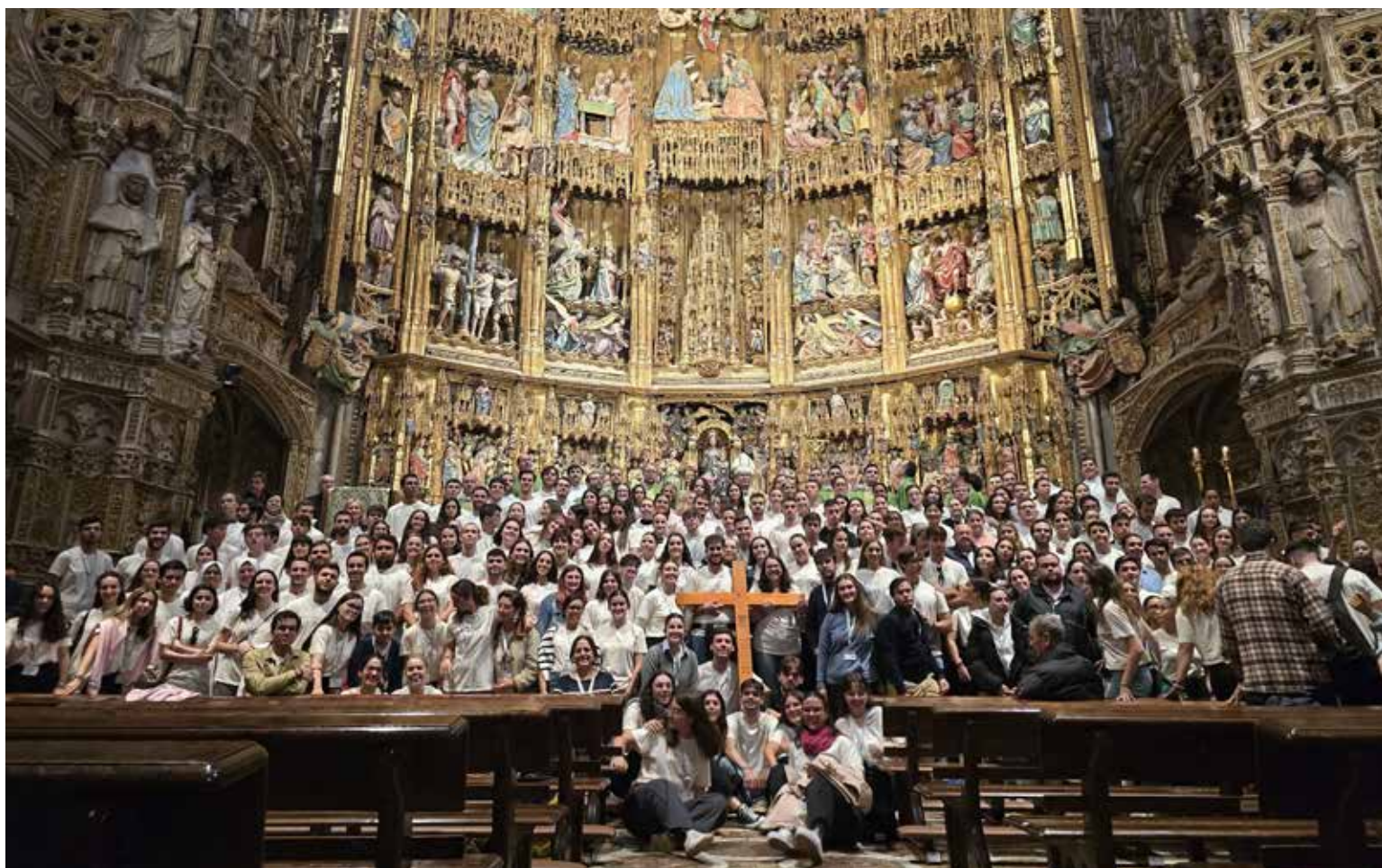
Algunos de los jóvenes participantes en el encuentro, con el Sr. Arzobispo y los sacerdotes concelebrantes, al finalizar la misa del pasado domingo.

El pasado fin de semana Toledo acogió el mayor encuentro UDISUR de jóvenes universitarios católicos, en el que participan universitarios de nuestra archidiócesis desde el año 2022.. Entre los diversos actos asistieron a la eucaristía dominical en la catedral, que fue presidida por el Sr. Arzobispo.