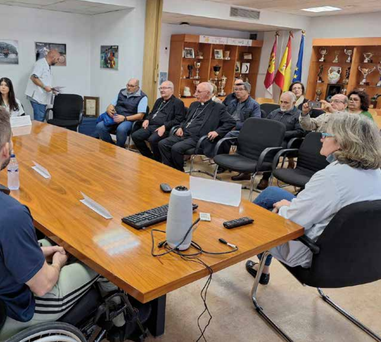
Arriba, la mesa redonda en el Hospital de Paraplégicos. A la izquierda algunas autoridades asistentes y una de las sesiones de trabajo.