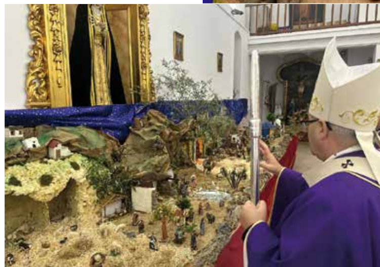
Bendición del Belén en la parroquia de Yeles, el pasado año.

La Asociación Diocesana de Belenistas propone también la Bendición de Belenes por vicarías, una actividad que se puede y debe realizar en todas las parroquias por medio de los sacerdotes de las mismas, pero, al igual que se hizo el año pasa-