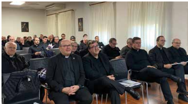
El Consejo Presbiteral durante la reunión del pasado 28 de noviembre.

Con el Sínodo, añadió, «vamos a caminar juntos con Cristo», para constatar seguidamente que «marcará el trabajo pastoral de la archidiócesis durante tres años y posiblemente