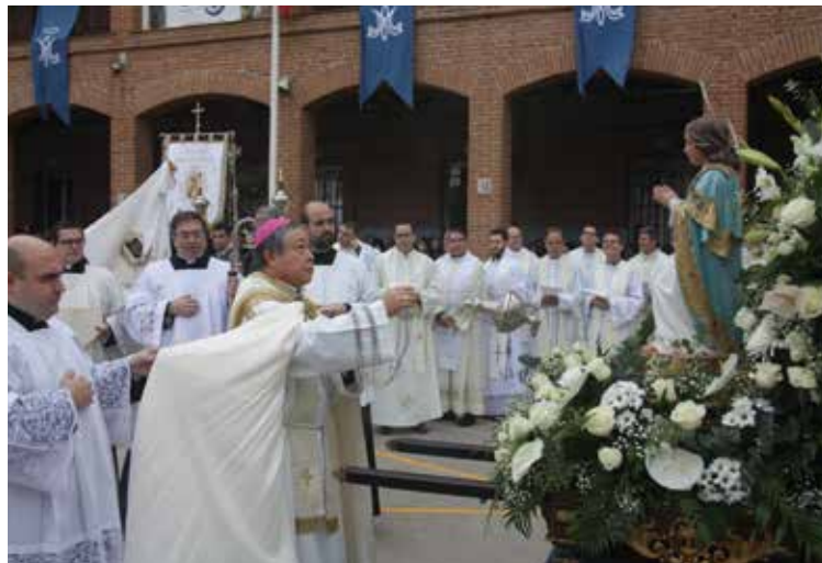
El Nuncio del Papa durante la celebración del pasado 22 de noviembre.

En primer lugar, la llegada de las madres fundadoras desde Tudela, el 22 de septiembre de