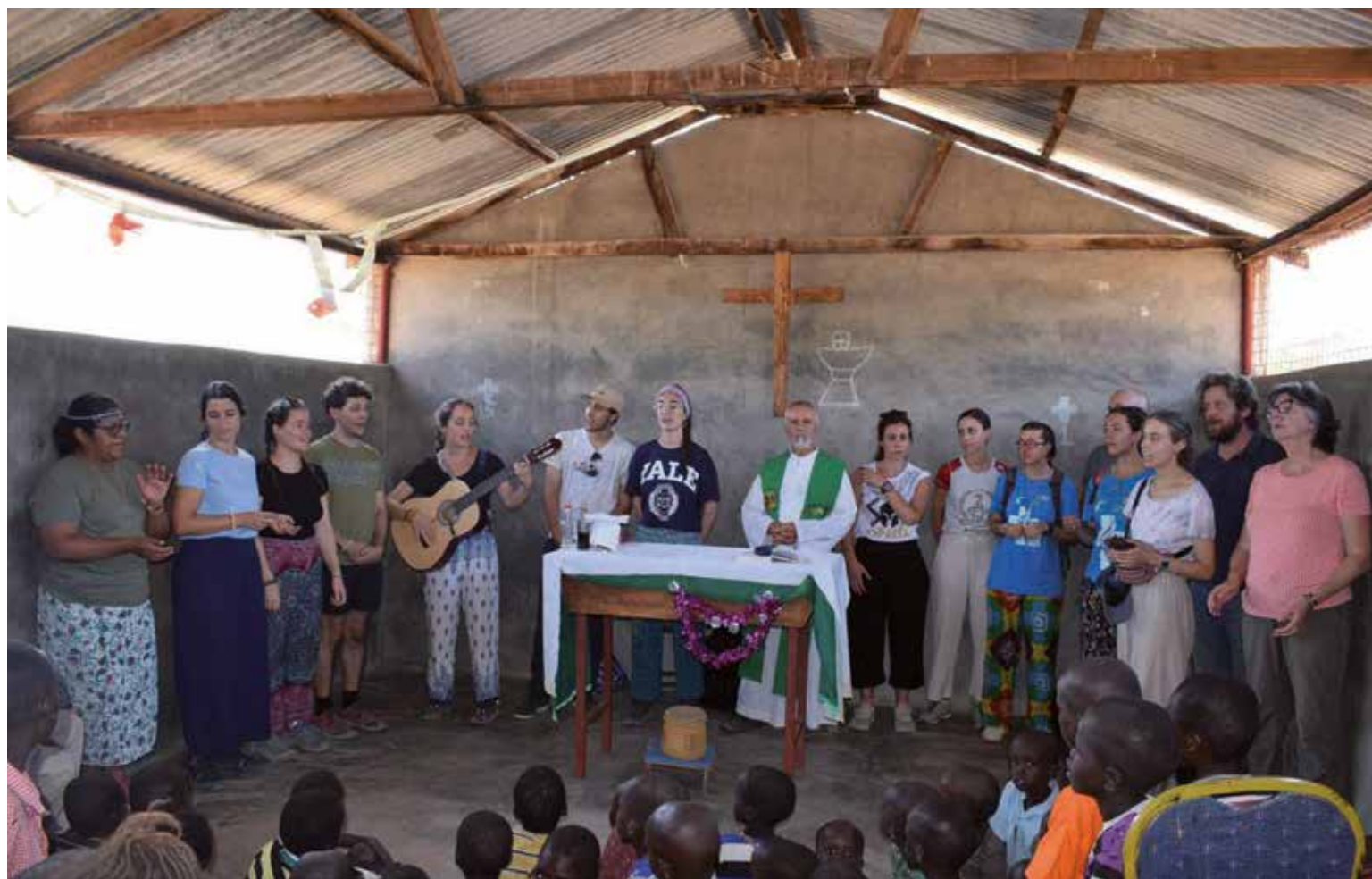
Jóvenes de voluntariado misionero en Kenia, el pasado verano, participan en la celebración de la eucaristía.

El continente con más misioneros toledanos es América y el país donde se concentran en mayor número es Perú, donde 17 sacerdotes diocesanos atienden la Prelatura de Moyobamba y la misión de Lurín.