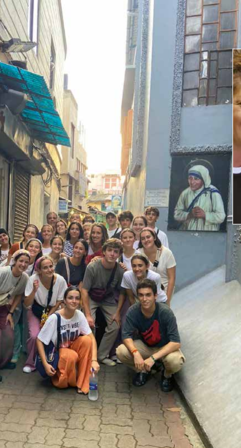
...es participantes en la misión de verano en Calcuta.