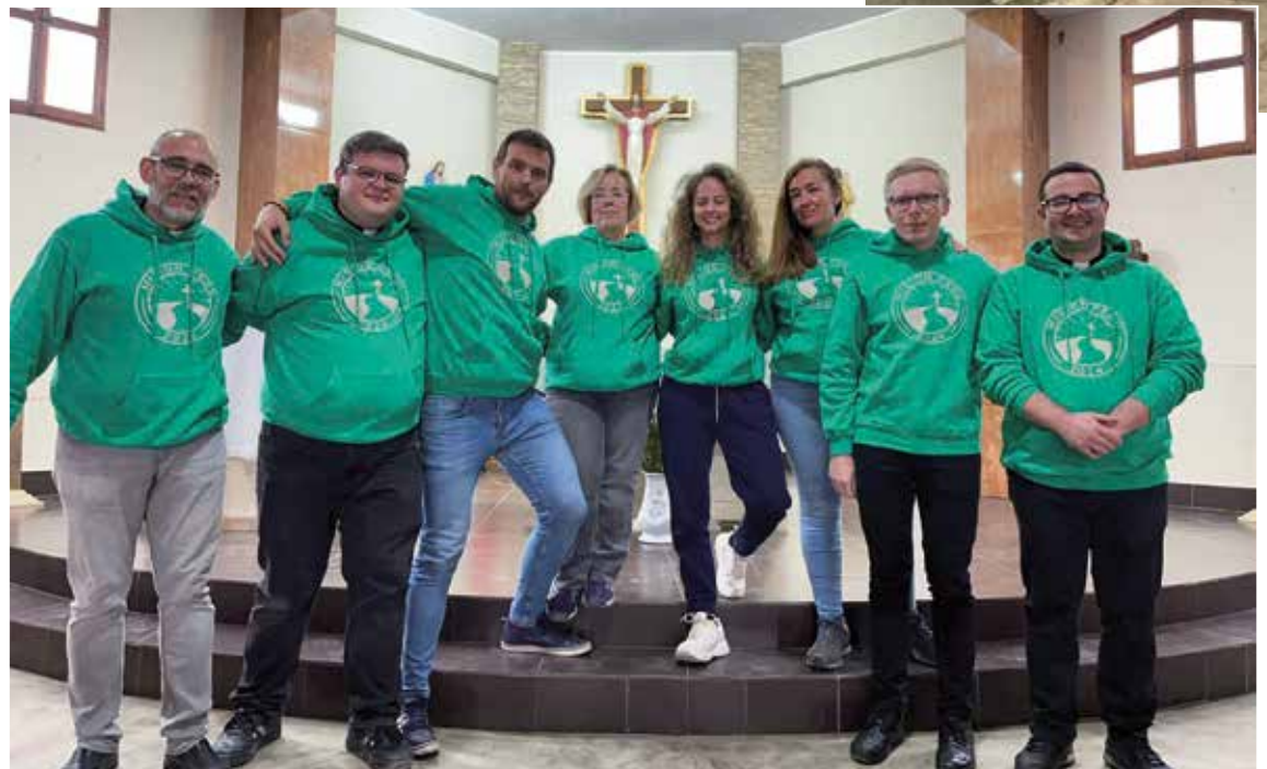
Algunos de los participantes de la misión en verano en la diócesis peruana de Lurín.

Pero todos estamos llamados a colaborar y participar en la misión «ad gentes». El Papa Francisco en su mensaje del DOMUND 2024 recuerda que «la misión universal requiere el compromiso de todos». En nuestra archidiócesis, además del centenar de misioneros y misioneras, han sido numerosas las personas que han respondi-