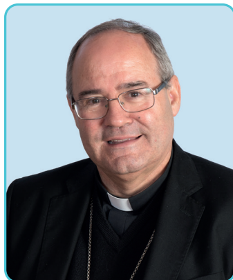
† Francisco Cerro Chaves Arzobispo de Toledo y primado de España

Queridos hermanos: la Jornada de la Iglesia Diocesana es, un año más, ocasión para describir la vida de la archidiócesis de Toledo y preguntarnos cómo será nuestro caminar en los próximos años; desde el inicio de mi pontificado como arzobispo vuestro he trabajado para que seamos una Iglesia transparente y para que los recursos que tenemos estén al servicio de los pobres y de la evangelización.