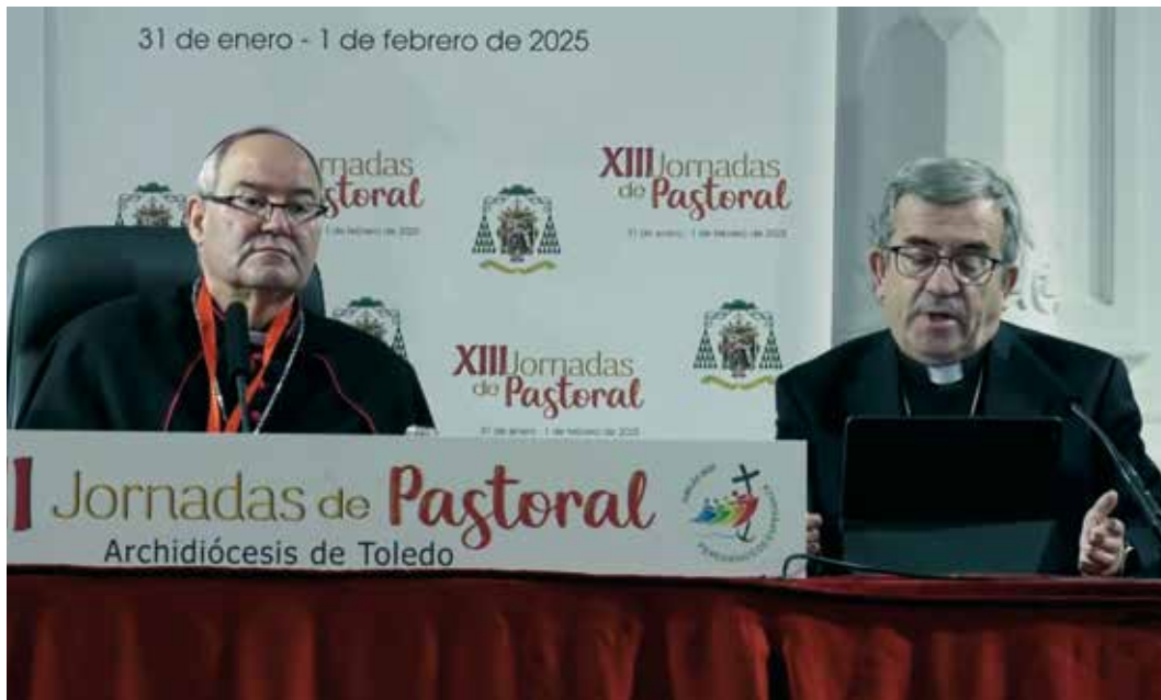
El presidente de la Conferencia Episcopal Española pronunció la primera ponencia de las Jornadas.

Durante las XIII Jornadas de Pastoral el Sr. Arzobispo presentó su carta pastoral «Caminando juntos con Cristo», dedicada a la preparación inmediata a la celebración del Sínodo diocesano