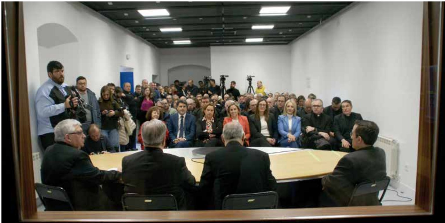
Los asistentes al acto, a través del visor del control de realización de televisión.

UNA APUESTA DECIDIDA POR LA EVANGELIZACIÓN A TRAVÉS DE LOS MEDIOS