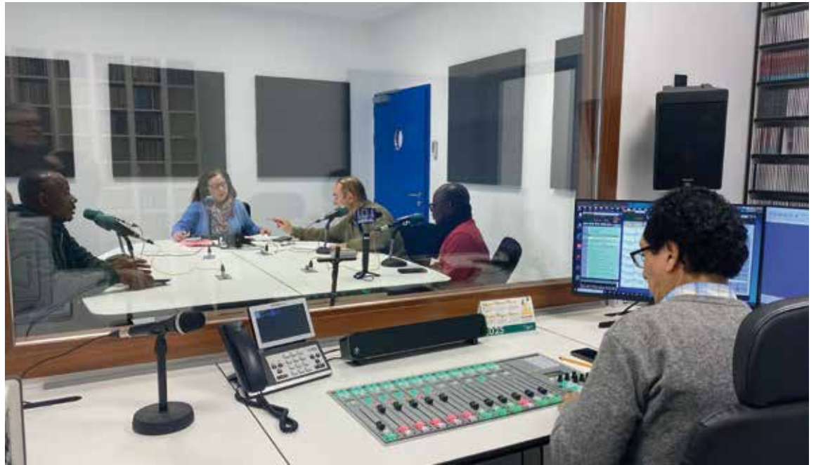
Uno de los nuevos estudios de Radio Santa María de Toledo.

«Hoy –constató el Sr. Arzobispo– Radio Santa María de Toledo y Canal Diocesano