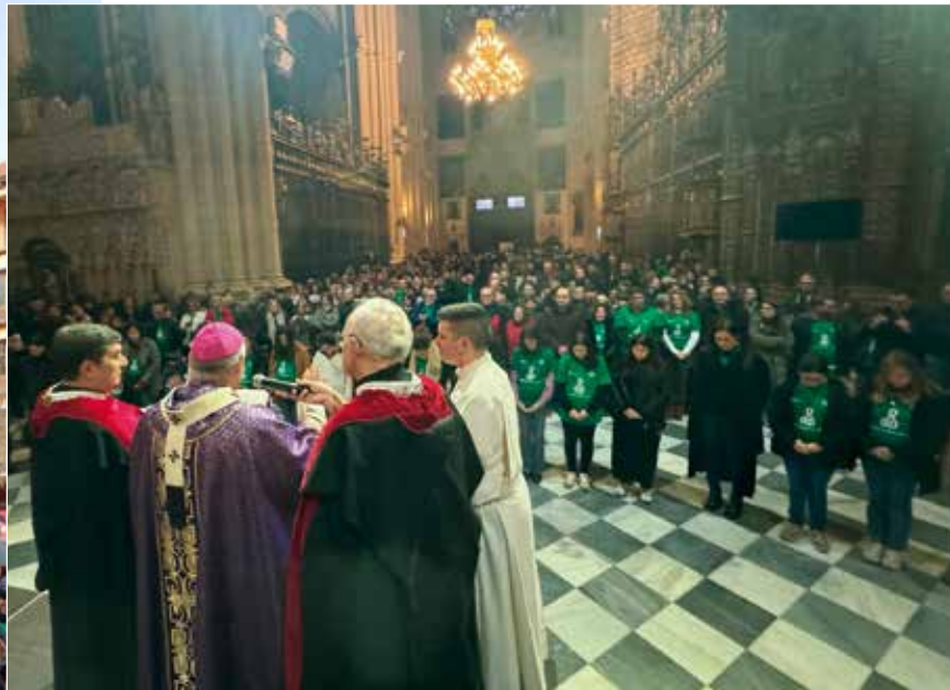
El Sr. Arzobispo imparte la bendición a mujeres embarazadas.

Por último, reiteró el agradecimiento a todas las personas que han colaborado en esta jornada que se empezó a planificar en el mes de septiembre «y, aunque supone mucho trabajo, la defensa de la vida compensa». También agradeció a la Vicaría de laicos, familia y vida, con la Delegación de Familia, su ayuda, así como a la televisión diocesana, «que permitió acercar este evento a toda la archidiócesis», y al coro de jóvenes de la parroquia de Illescas por animar la celebración eucarística.