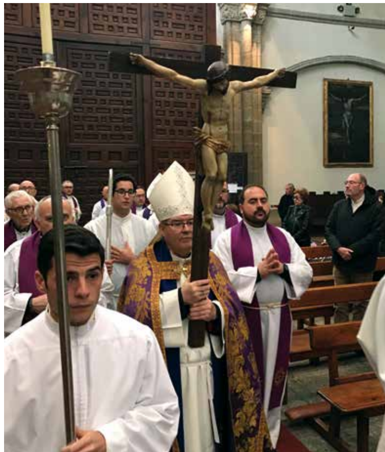
Entrada procesional en la iglesia colegial de Santa María.

En su intervención el arcipreste de Talavera dio las gracias al Sr. Arzobispo «por estos meses de intensa y gratificante visita pastoral, por este tiempo que nos ha dedicado», así como «por tantos momentos únicos vividos a su lado y que nunca se