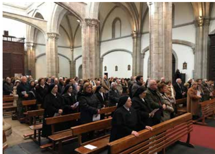
Algunos de los asistentes al rezo de las segundas ví.

La celebración concluyó con el canto de la Salve, ante el espectacular lienzo de la Asunción de Nuestra Señora, de Mariano Salvador Maella.