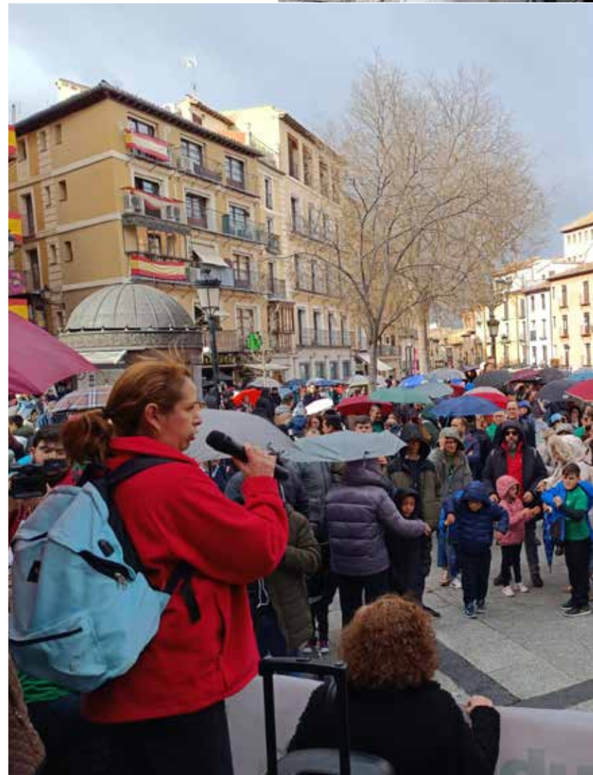
En la plaza de Zocodover se hizo público un manifiesto en favor de la vida.